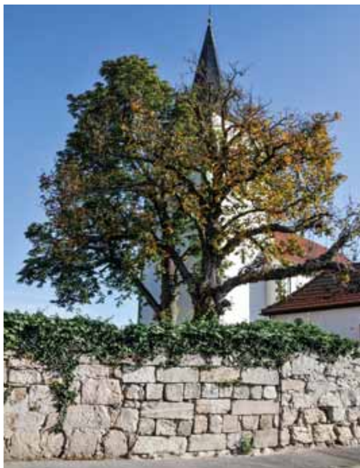
Foto: Friedhofsmauer von Gellershausen aus Sandstein, Bruno Schubarth