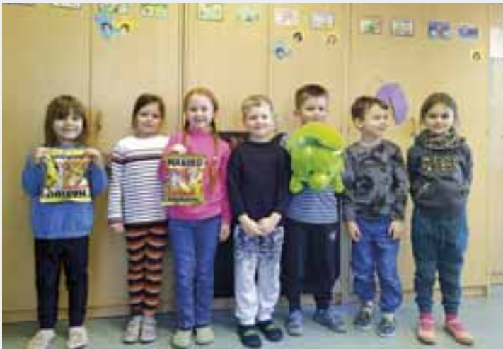
Das sind die Kinder des Kindergartens „Pustebume“ in Westhausen, die die Gewinner des Adventsrätsels 2024 gezogen haben.