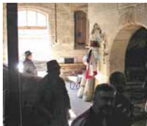
Im schönen Brauhaus

Das heute vorhandene Brauhaus wurde nach Abriss des alten 1861 errichtet und man sieht, dass da gute Baumeister zu Werke gingen. Ich behaupte, es ist eines der größten und schönsten Brauhäuser in unserer Gegend. Es hatte auch seinen Preis, denn es mussten damals Kredite dafür aufgenommen werden.