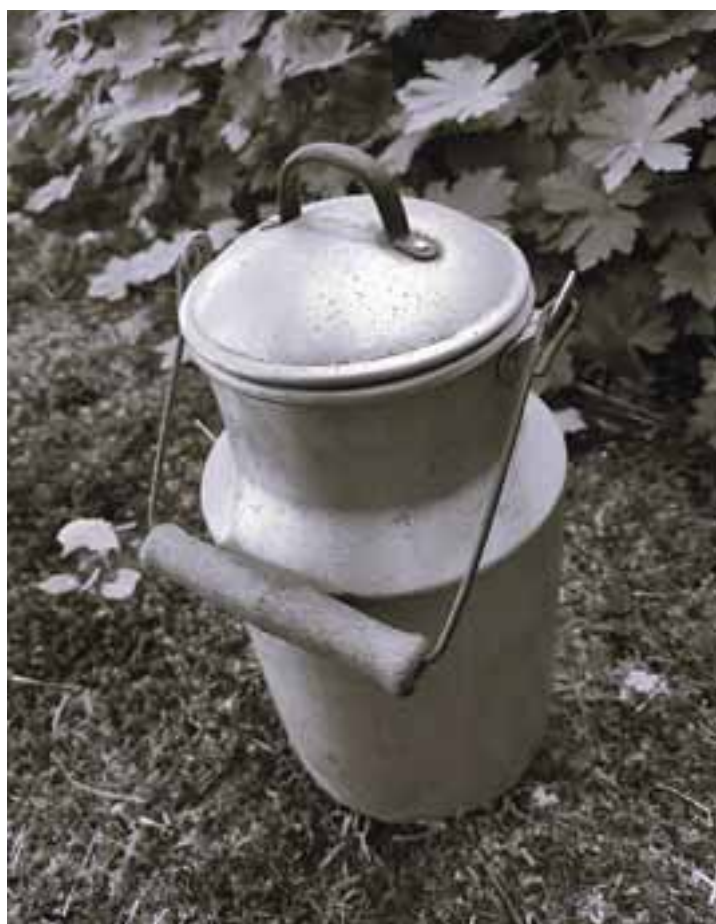
„Dös Millich - Kännlá zum Beersüchen“