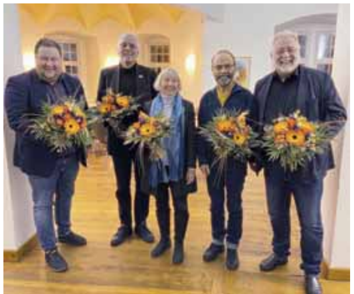
Vorstandswahl Trägerverein des Deutschen Burgenmuseums Veste Heldburg im Januar 2024